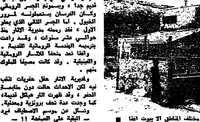
المورد الكهربائي الذي يوزع المياه الى مختلف المناطق الا بيوت افقا

لا هاتف عننا ويستبد المحب يختار افقا حين تسلكه من الهاتف فيصيح لا هاتف عننا ولا يتكلمنا بهذا الصبر للحدث، لأن الهاتف يمثل منذ قبل الاحداث، ولا يستغفرون احد اذا كان ابن افقا يتسائل عما اذا سيحتمل الهاتف الاي يوما ما، ويتكلم مع ابنه الحديثة، ام يسبني ذلك حلما يراوده، في وقت بدأ فيه العالم يتصل بعنسه ببعض عبر الكوكب والاجرام السماوية. أخذوا مياهنا وعندما تصل بالحديث الى المياه يتهدد مخزن البداة ويقول اسم «افقا»